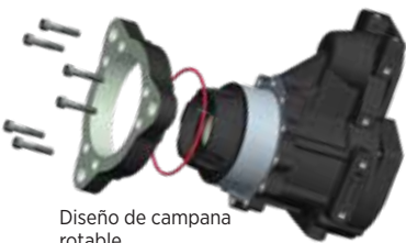
Diseño de campana rotatable