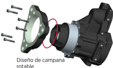
Diseño de campana rotatable